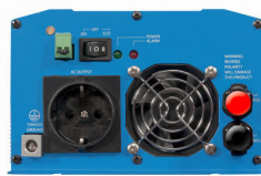
Phoenix Inverter 12/800 with Schuko socket