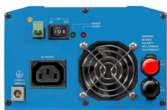
Phoenix Inverter 12/800 with IEC-320 socket