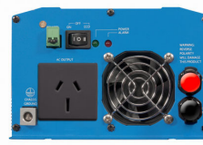
Phoenix Inverter 12/800 with AN/NZS 3112 socket