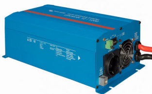
Phoenix Inverter 12/800 with Schuko socket

Va rugam, consultati imaginile de mai jos.