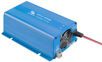
Phoenix Inverter 12/180