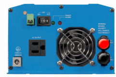
Phoenix Inverter 12/800 with Nema 5-15R socket