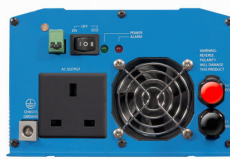
Phoenix Inverter 12/800 with BS 1363 socket