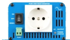
Phoenix Inverter 12/180 with Schuko socket